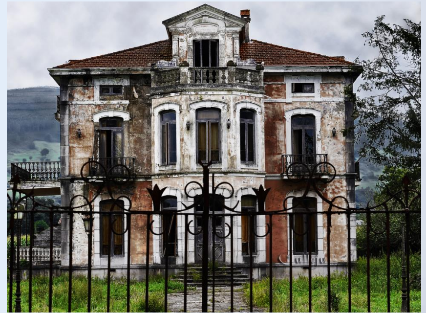
Casa del Indiano