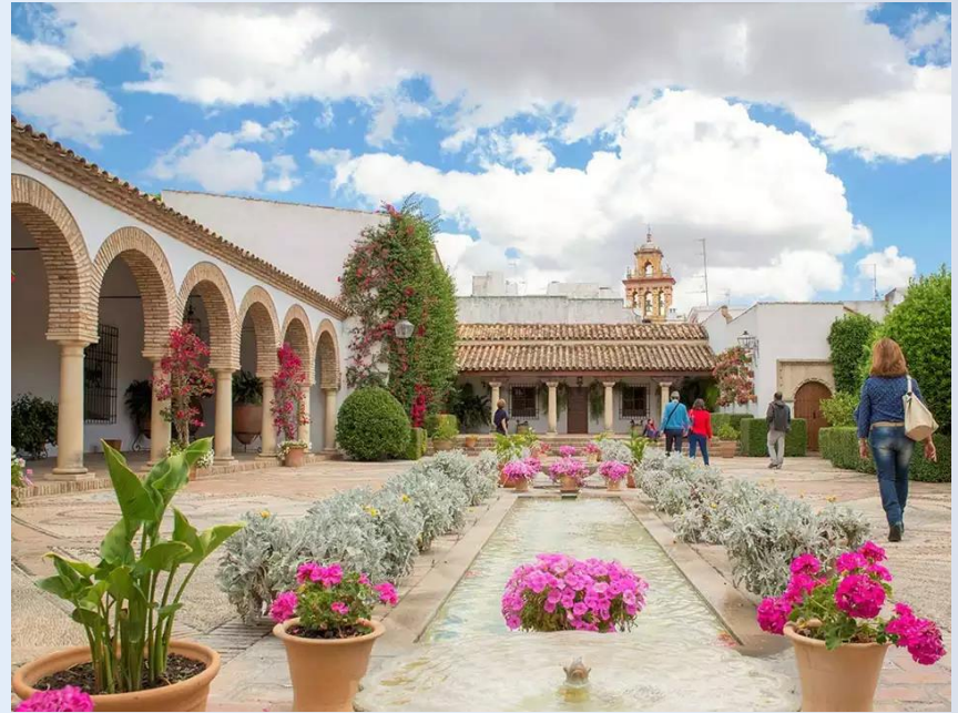
Palacio Museo de Viana