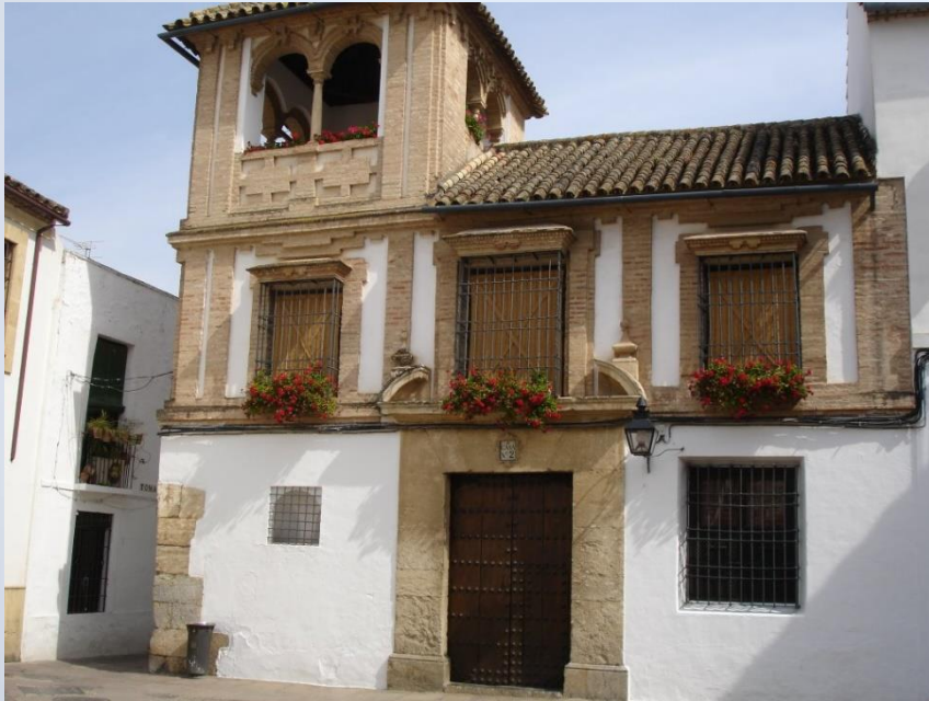
Casa de los Villalones