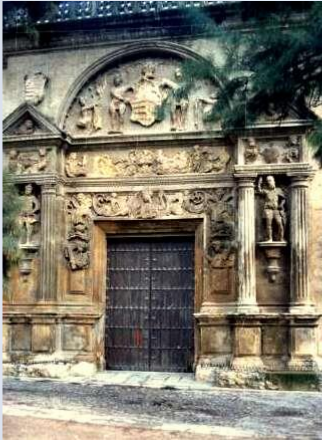
Palacio de los Páez de Castillejo