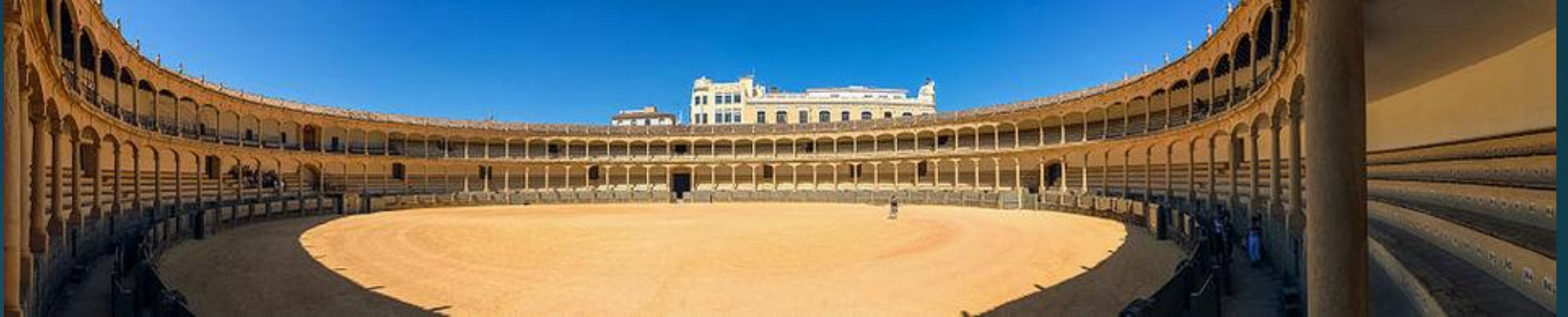
Plaza de Toros- najstarsza corrida w mieście