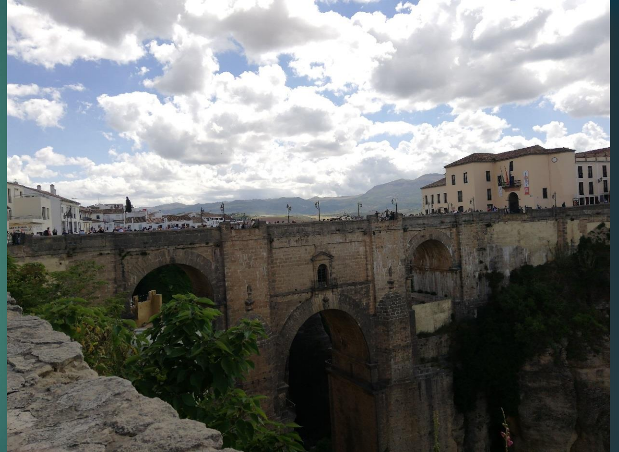
Puente Nuevo – największy most w Rondzie.