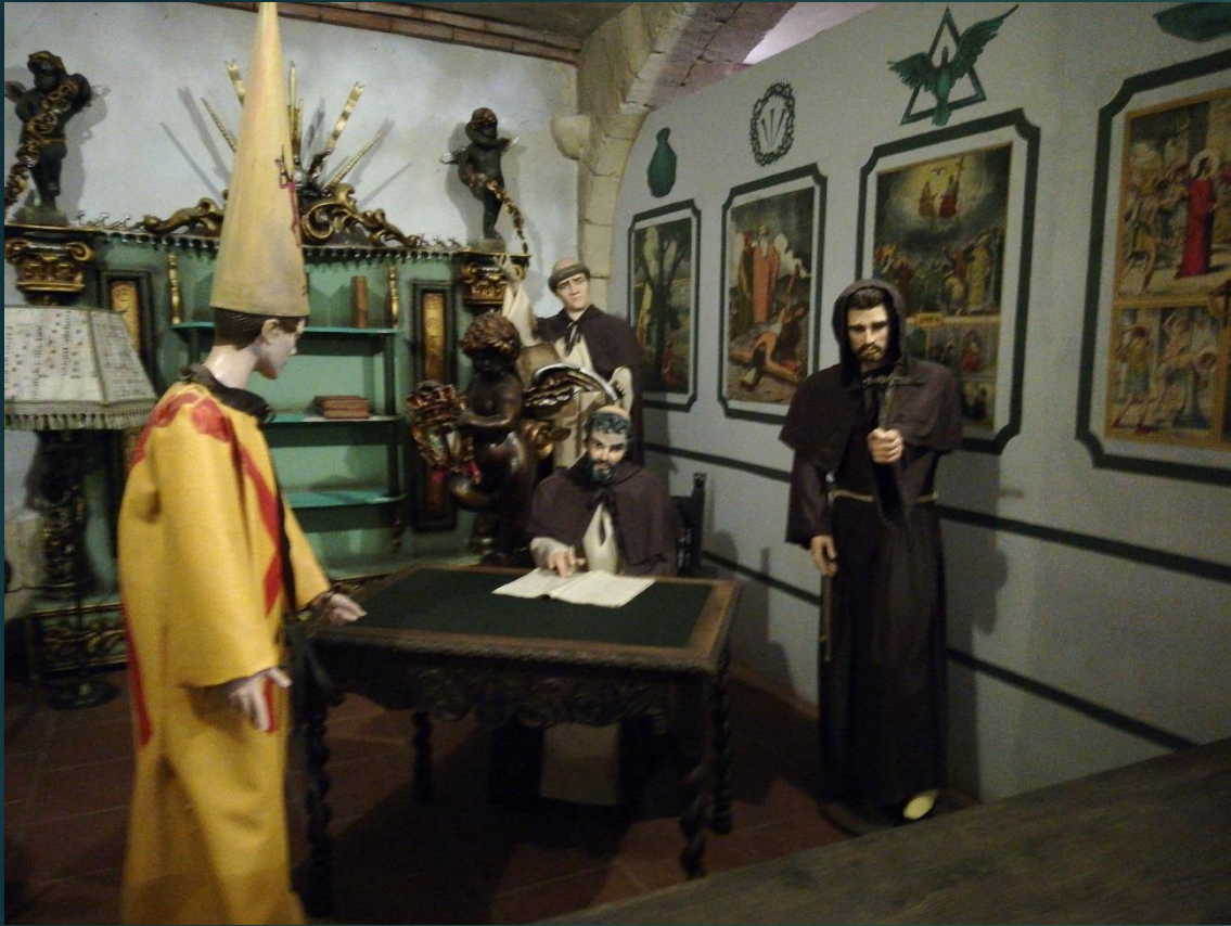
Inkwizycja stojąca na straży prawa