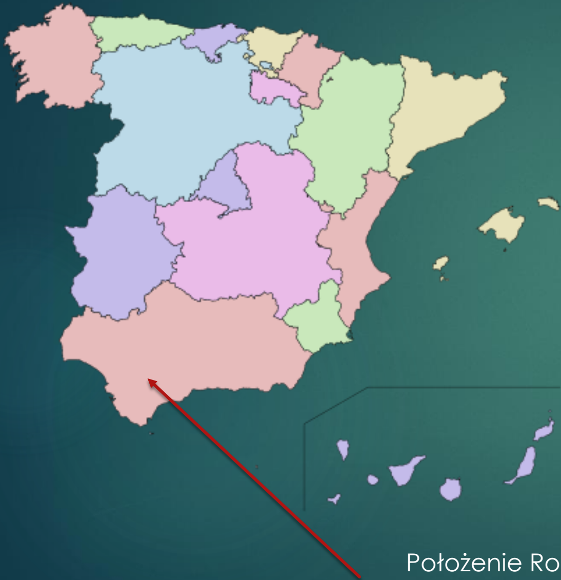
Położenie Rondy na mapie Hiszpanii