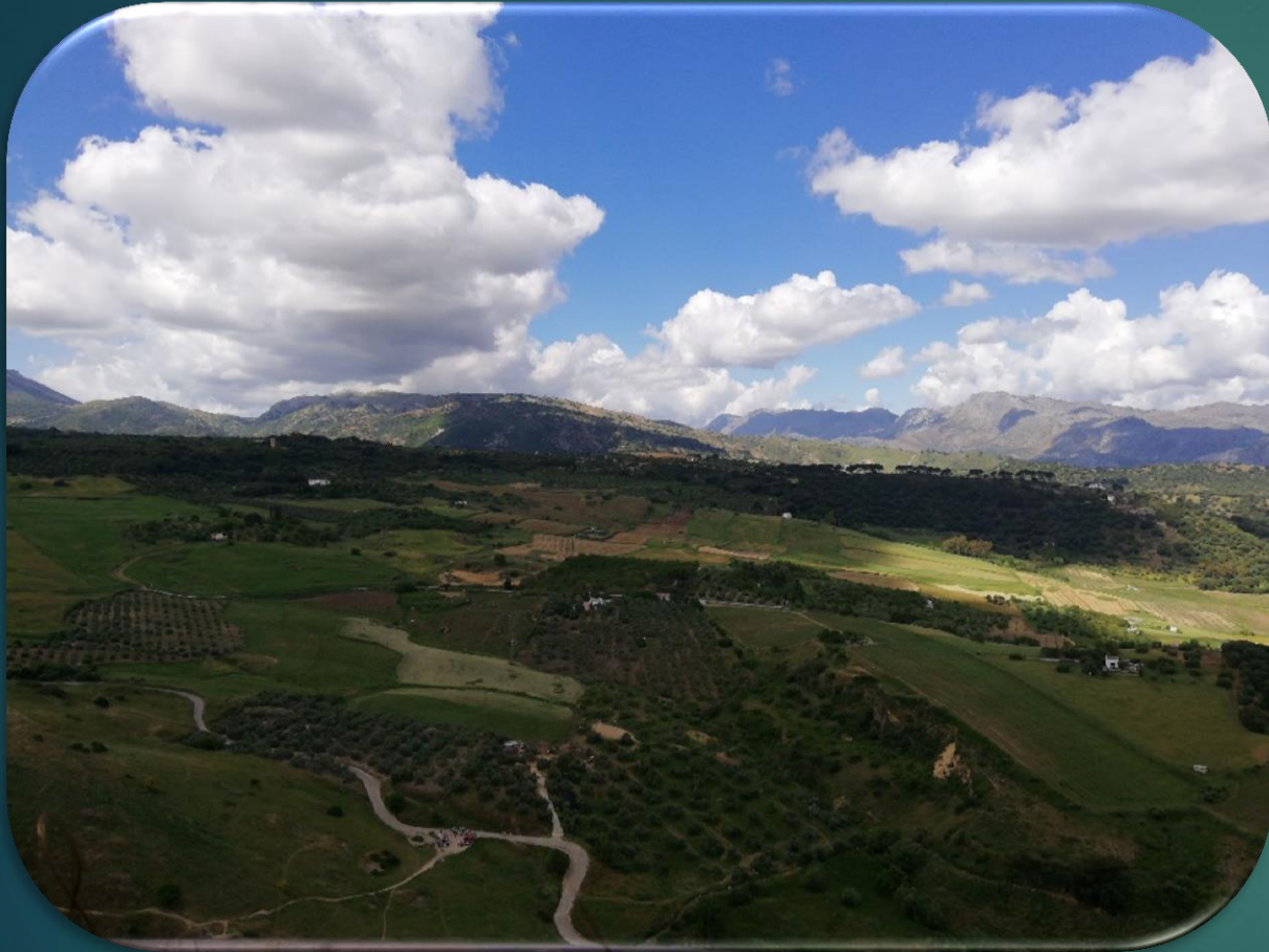
Widok z mostu