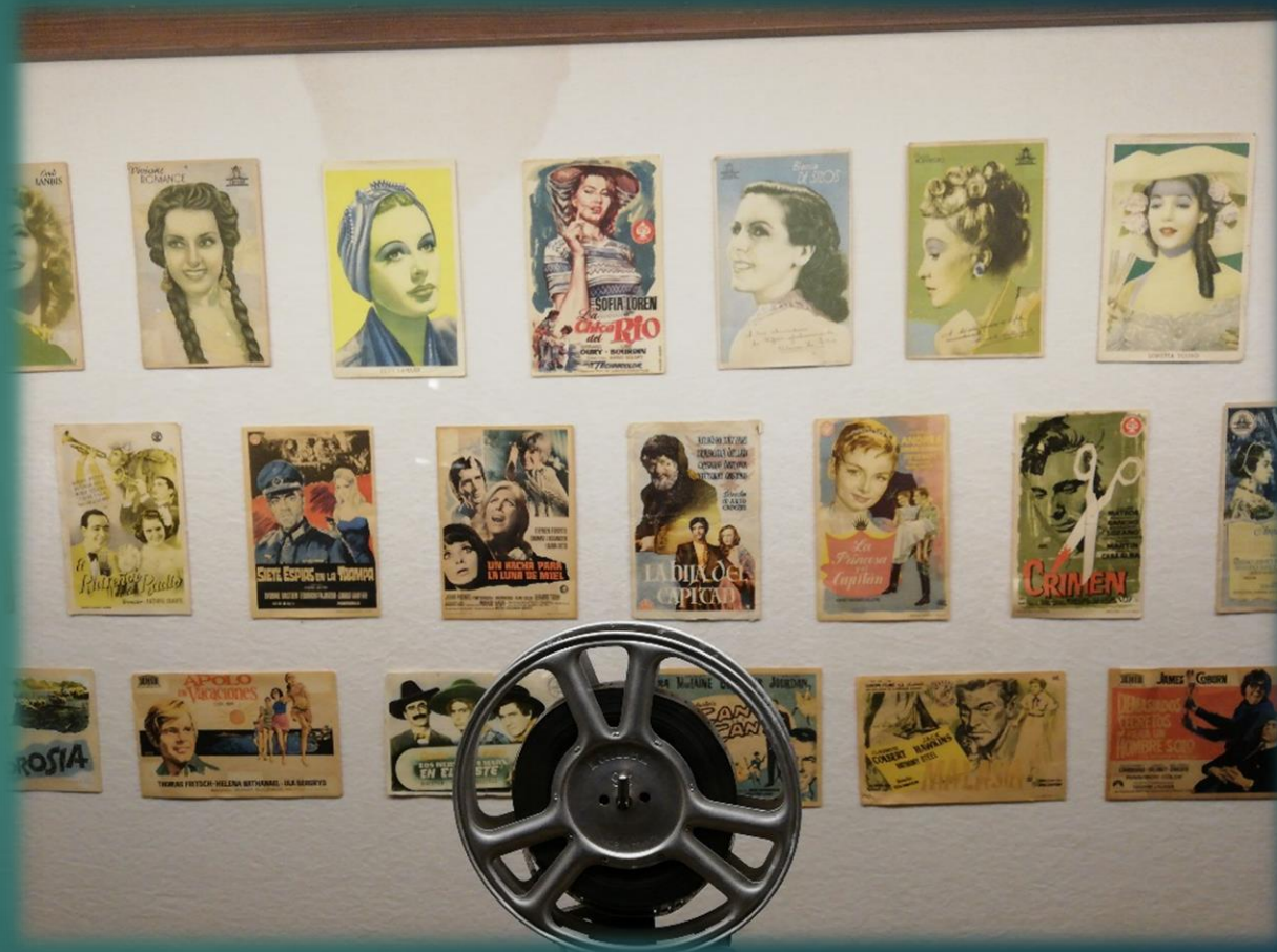
Zdjęcia hiszpańskich kobiet