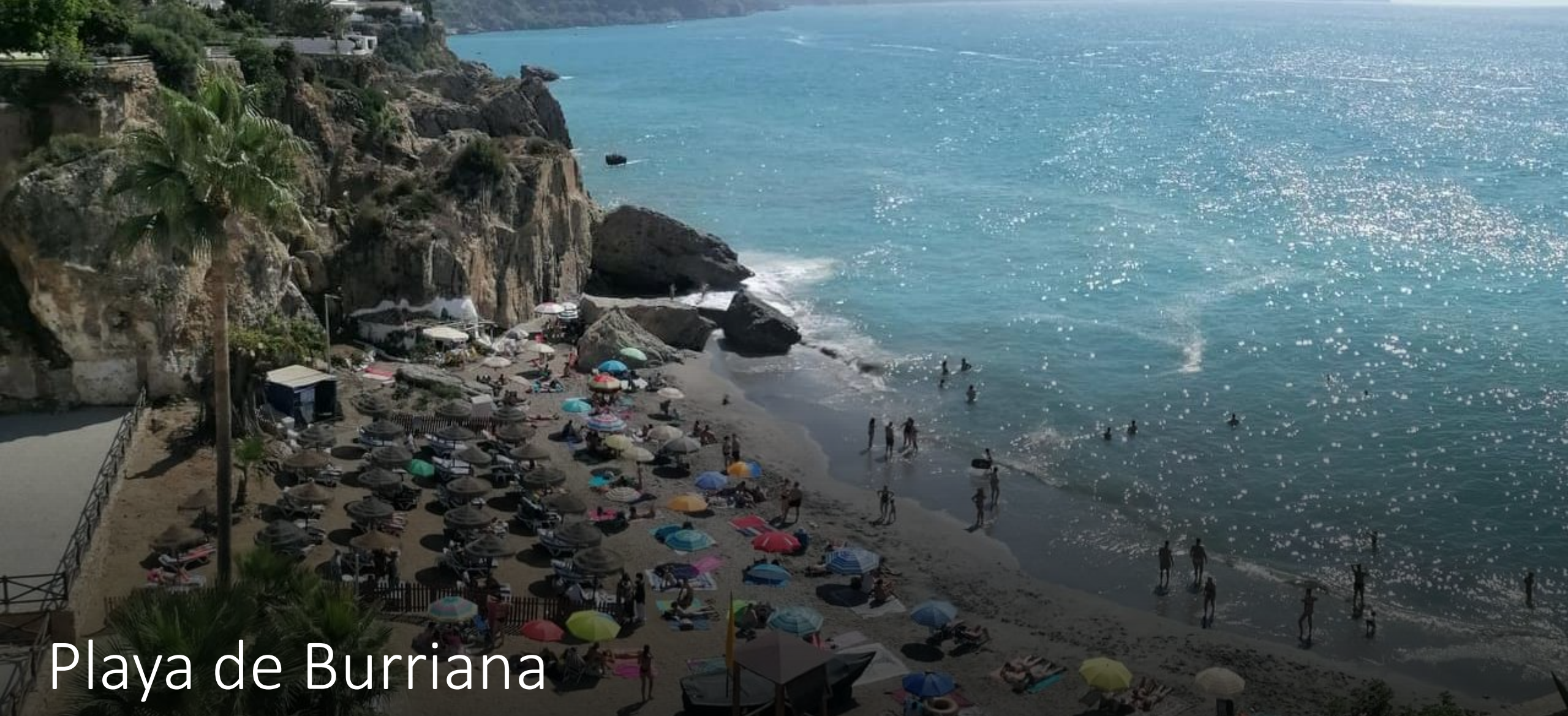
Playa de Burriana