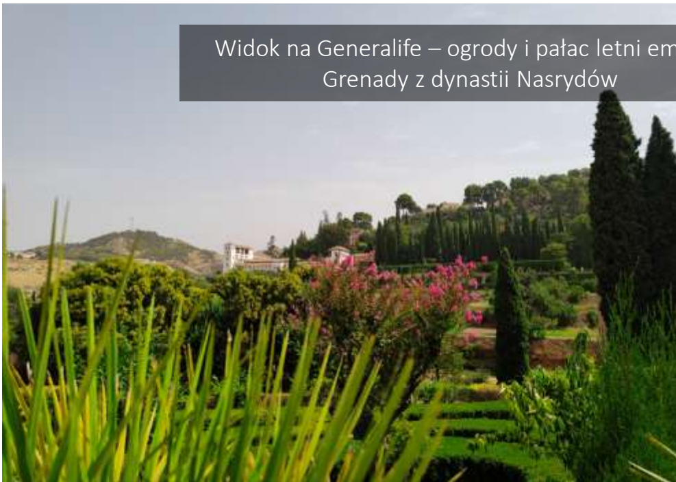
Widok na Generalife – ogrody i pałac letni emirów Grenady z dynastii Nasrydów