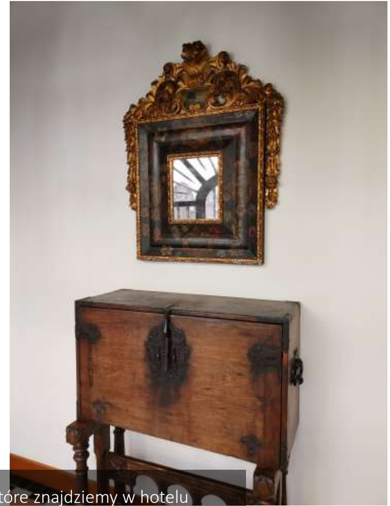
Ekspozycje oraz meble, które znajdziemy w hotelu