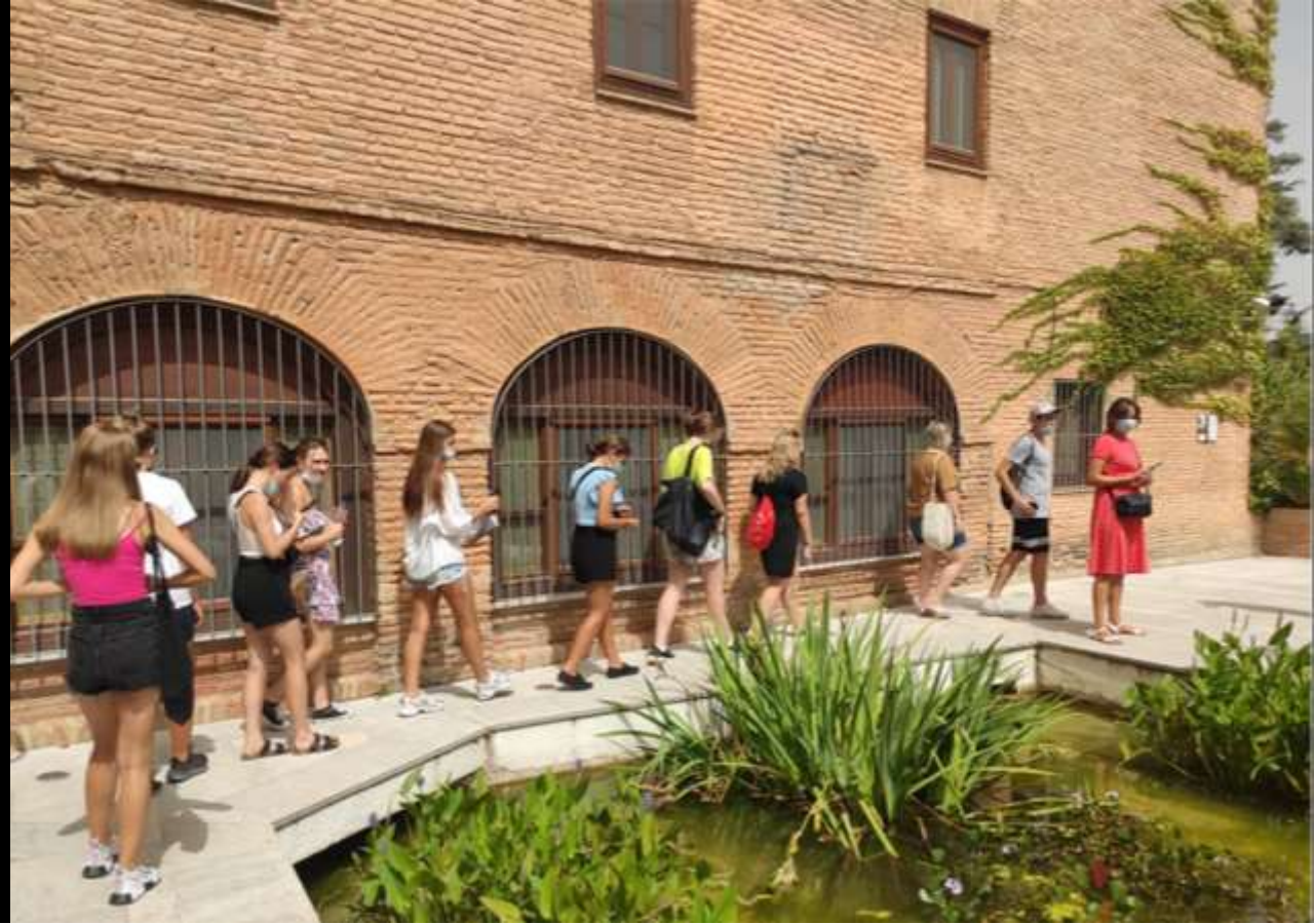
Grupa Erasmus+ 2021 zwiedzająca teren Hotelu Parador de Granada