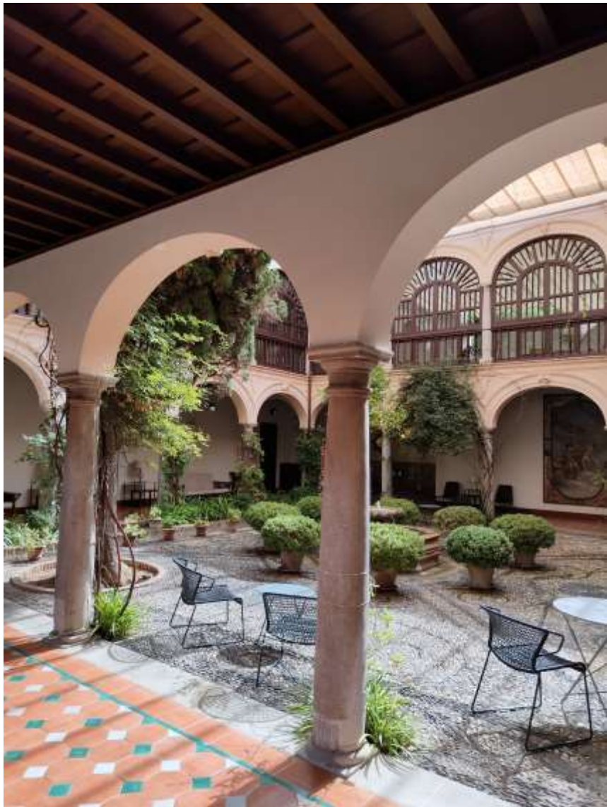
Obraz na jednej ze ścian krużgank