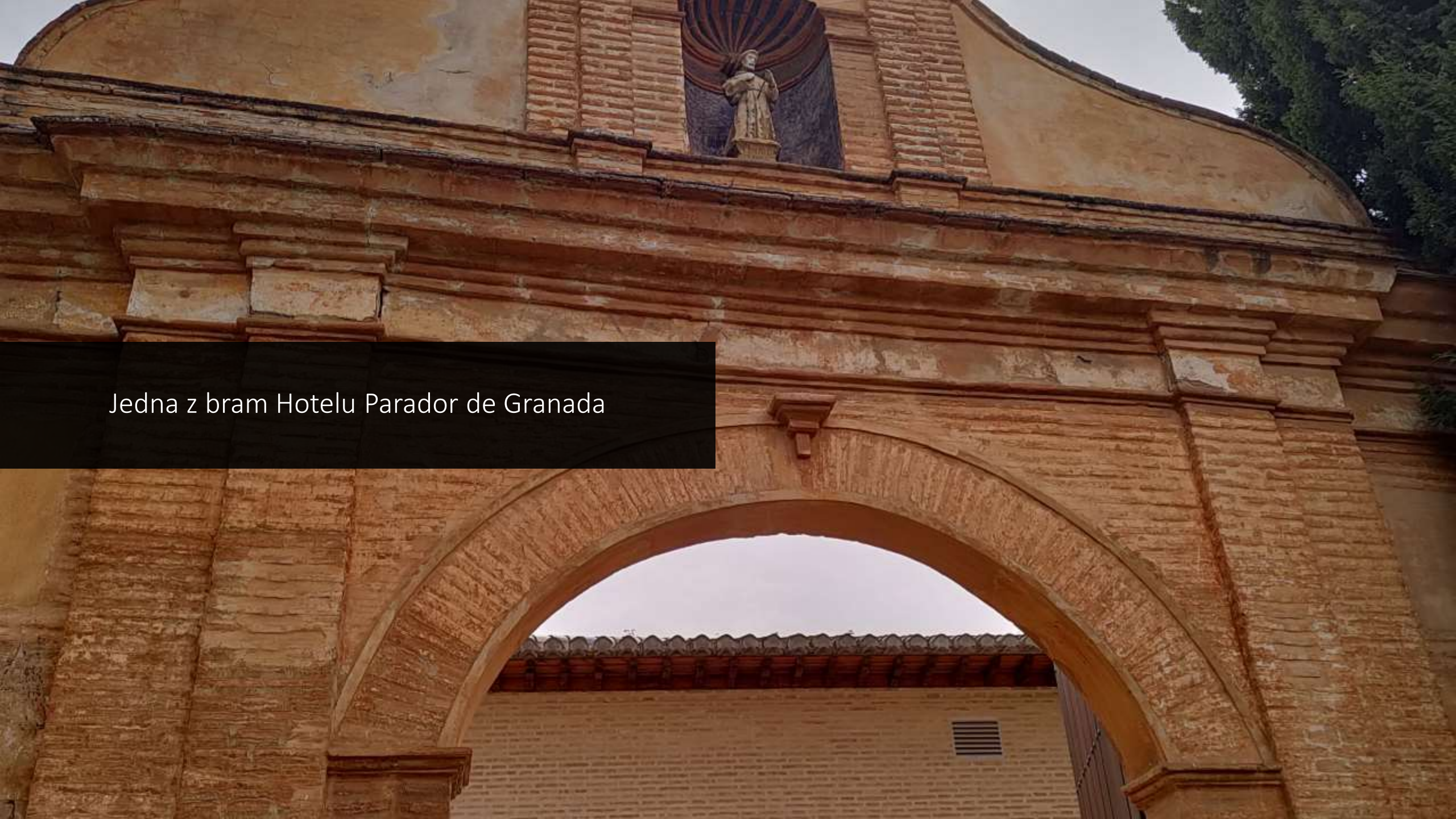
Jedna z bram Hotelu Parador de Granada